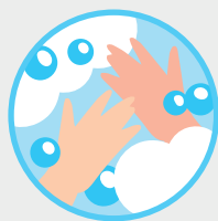
LÍMPIATE BIEN LAS MANOS