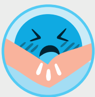
TOSE EN EL CODO