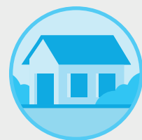
QUÉDATE EN CASA