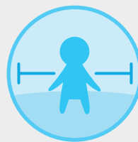
MANTÉN LA DISTANCIA